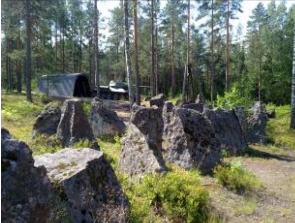
Panssarieste, Salpalinja Miehikkälä