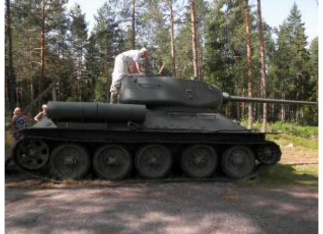
Panssarivaunu Sotka, mallia T-34