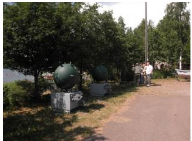
Merimiinat, Klamilan kalasatama.