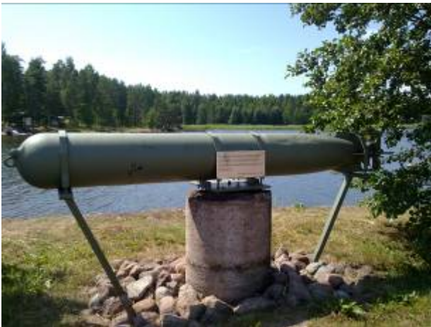
Torpedo, Klamilan kalasatama